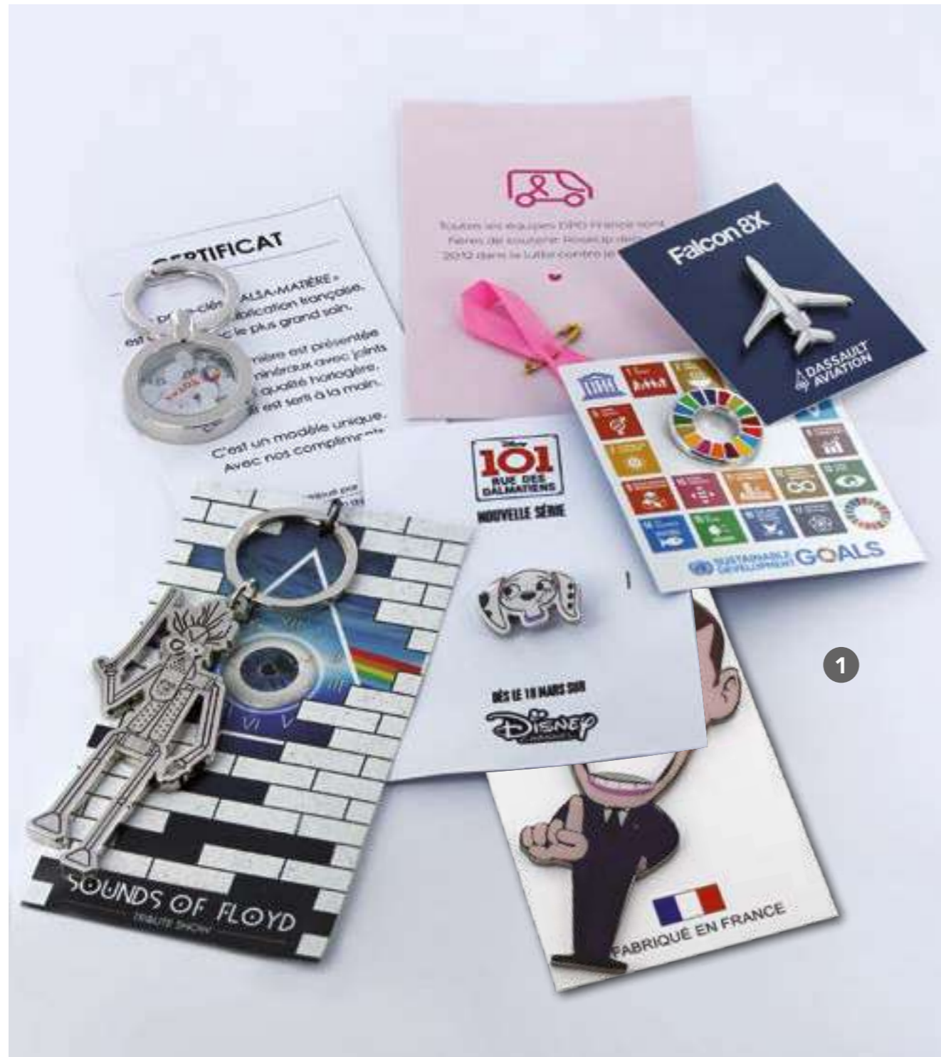
1 CAR-100 Cartonnette personnalisation du logo en quadri, Recto ou Recto/Verso sur papier 300 gr en accompagnement de bracelets brésiliens, porte-clés, « SALSA », pin's, rubans satin.... 0.48€