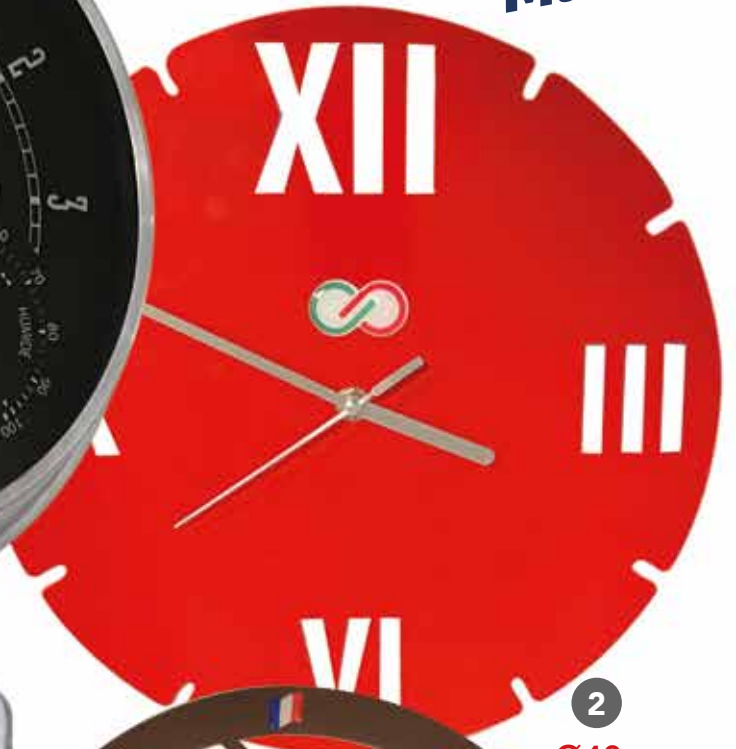
2 Ø40 cm