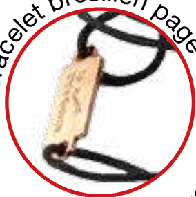
Bracelet brésilien page 42