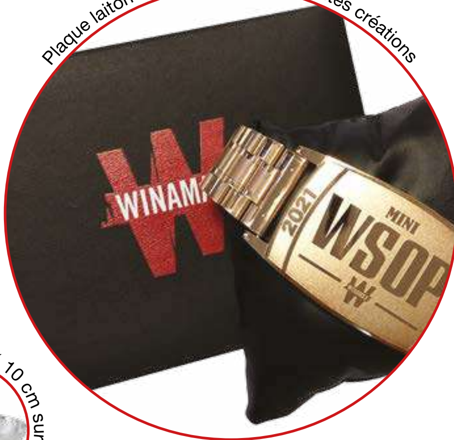
Plaque laiton Bracelet métal doré toutes créations