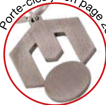
Porte-clés jeton page 23