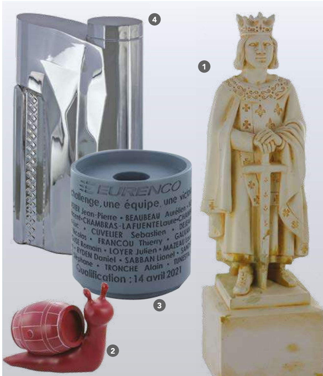
1 R-127-SL Trophée 3D, Poids 1.280 kg. Dim. 28 cm. Sur devis