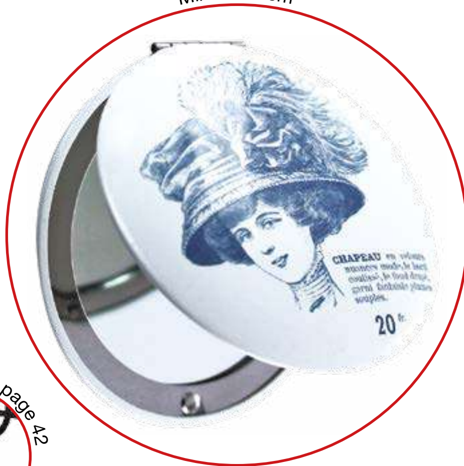
Miroir Ø 7 cm