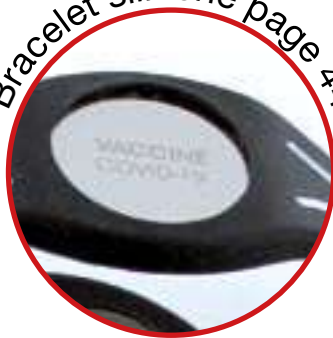
Bracelet silicone page 44