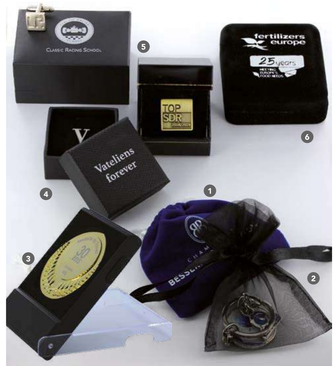
1 EMB-1 Bourse suédiva avec cordon coton. Dim. 100X80 mm. Marquage 1 couleur. 1.20€ 2 EMB-ORG Bourse organza de couleur. 0.80€ 3 EMB-PVC Ecrin PVC pour médaille 7cm, couvercle transparent pivotant. 2.60€ 4 EMB-CG Boite grainée. Dim. 50X50 mm avec couvercle. Marquage argenté. 2.20€ 5 E-51-LUX Ecrin bijouterie avec intérieur satin et suédiva. Fermeture clapet. Sur devis 6 EMB-FE Ecrin en feutrine. Dim. 60X60X30 mm. Marquage à chaud argenté. 5.60€