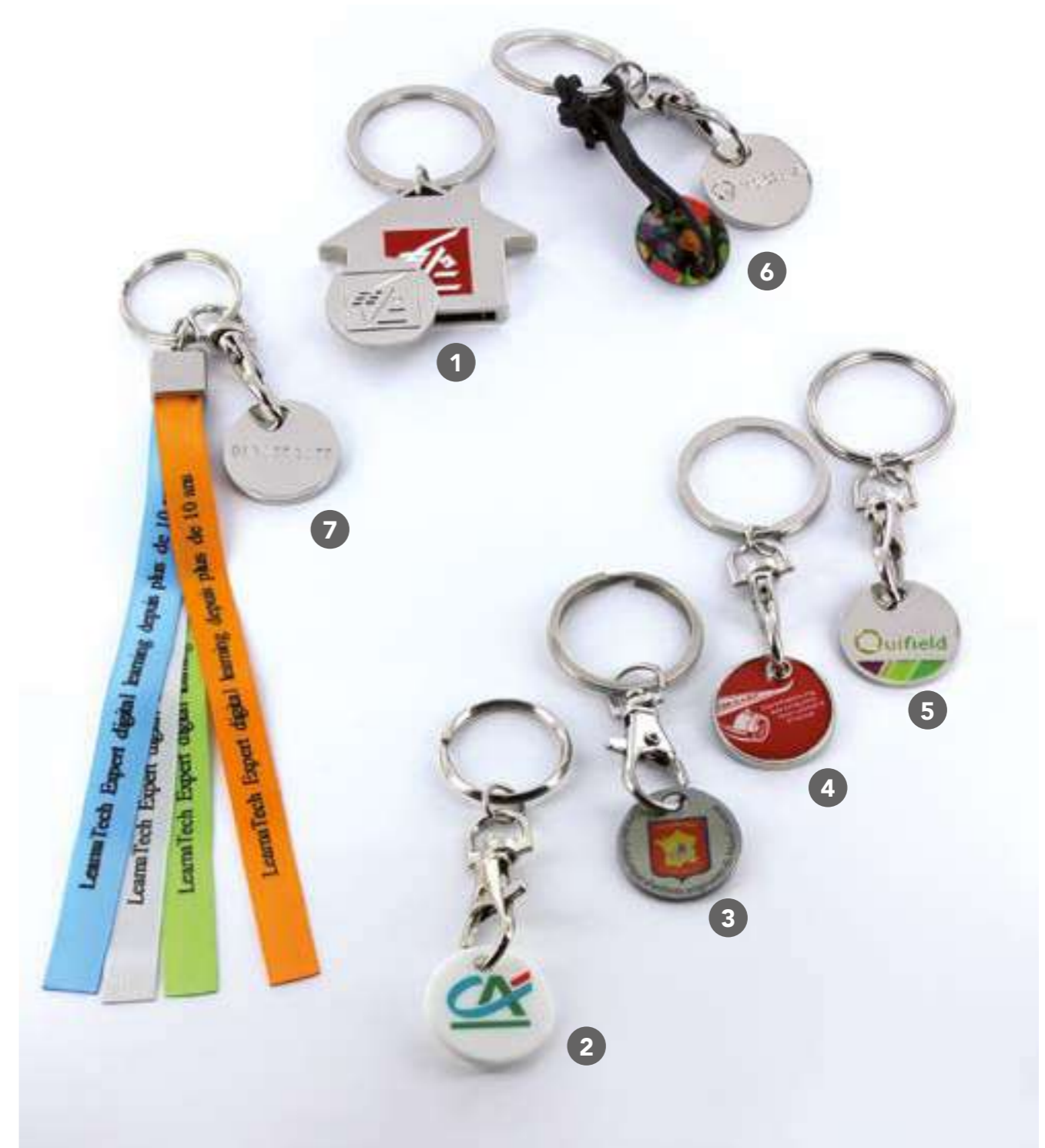
1 B-107-ZM Zamac à la forme, R°/V°, émaillé 3X3,5 cm avec jeton 4.60€