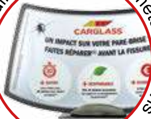
PVC toutes dimensions, socle métal sur devis