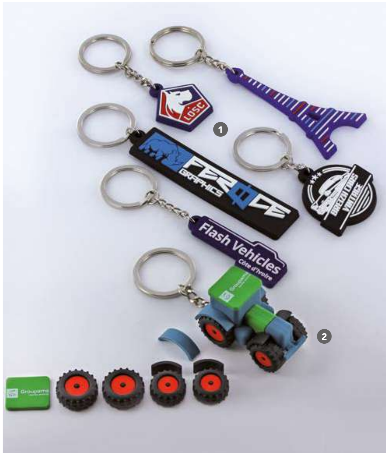
1 B-101-FC PVC souple, découpé à la forme, full couleurs. Sur devis