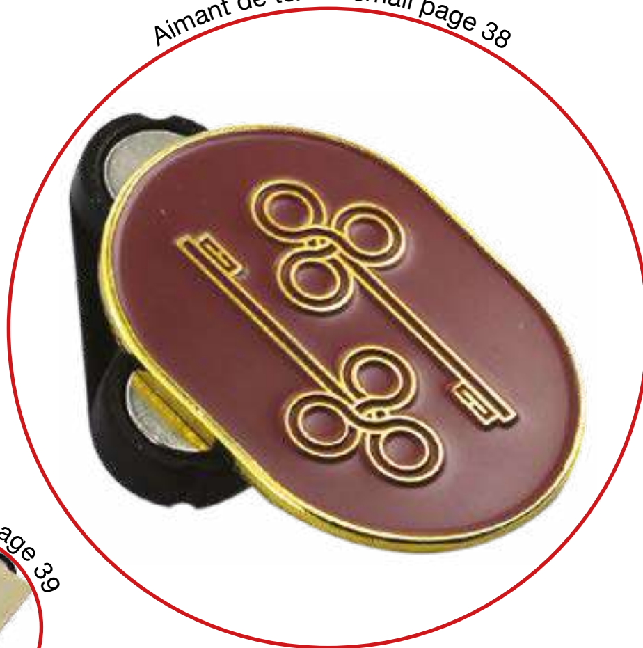
Aimant de textile émail page 38