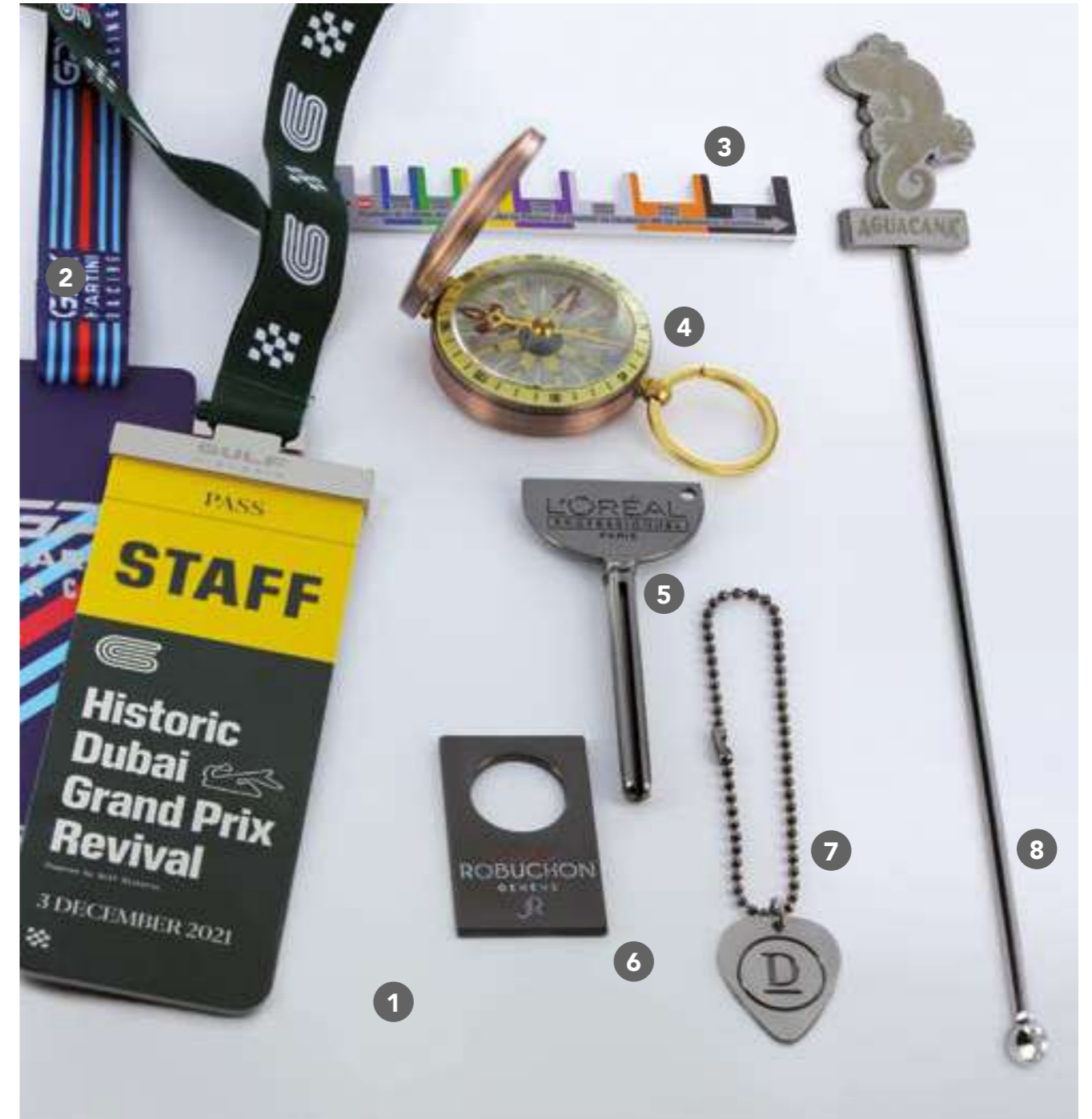
1 D-PVIP Pass VIP barrette en zamac nickelé + laser. PVC rigide quadri R°/V°. Lanyard. 6,20€