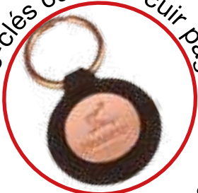
Porte-clés cuivré + cuir page 20