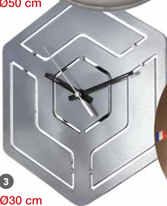
3 Ø30 cm