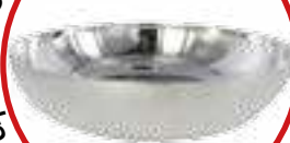
Coupelle laiton nickelé Ø 10 cm sur devis