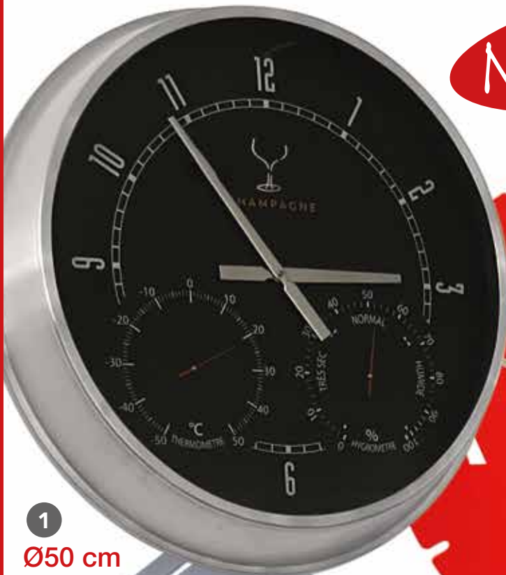
1 Ø50 cm