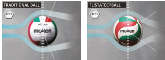
DESIGN REVOLUTIONNAIRE EN NID D'ABEILLE